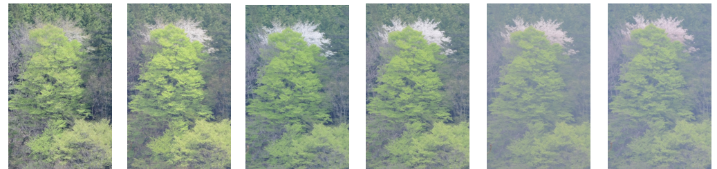
5/05 5/06 5/07 5/08 5/09 5/10